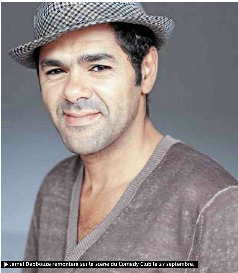
► Jamel Debbouze remontera sur la scène du Comedy Club le 27 septembre.

"Le Marrakech du rire" et 100 % Debbouze, ce soir à 20 h 45 et à 22 h 50 sur M6.