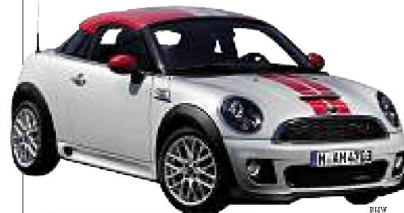
► La Mini Coupé de BMW.

Au Salon de Francfort, en Allemagne, les constructeurs misent sur les modèles destinés aux urbains (p 24)